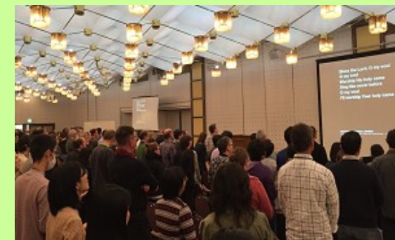
CPI 全国カンファレンス大会 (H29/10/25~27)

昨年秋に千葉県熊谷市で開かれた CPI 全国カンファレンス(10/25~27)MB 伝道委員会の一員として参加しました。CPI カンファレンスは宣教師数家族によって始まり、日本の開拓伝道者のためのセミナーとして、国内外から数百名の奉仕者を含む参加者があり、日本への宣教師にとって励ましの場です。日本に福音がさらに伝えられ教会が新しく立てられることを目的としたこのカンファレンスは、英語と日本語で行われました。全体集会と分科会で英語の割合が多いですが通訳がありました。特に印象に残ったのは、教会開拓のためのネットワーキングという考え方です。教会開拓には孤立するのではなく、人に一方的に依存